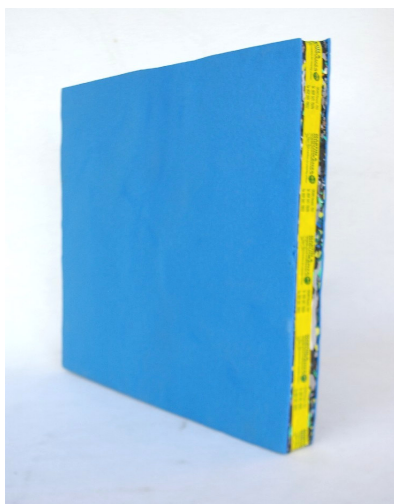
Art. A-546 cm 132x132x6/7