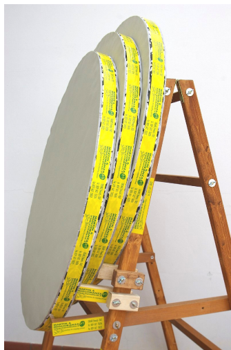
N. 3 Art. A-540 sfalsati Su cavalletto A-402