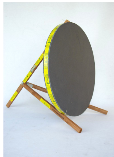
Art. A-540 su cavalletto A-308 Pieghevole, girato HF