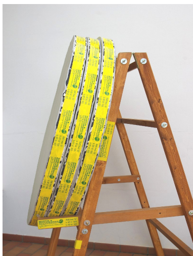
N° 3 Art. A-540 appaiati Su cavalletto art. A-402