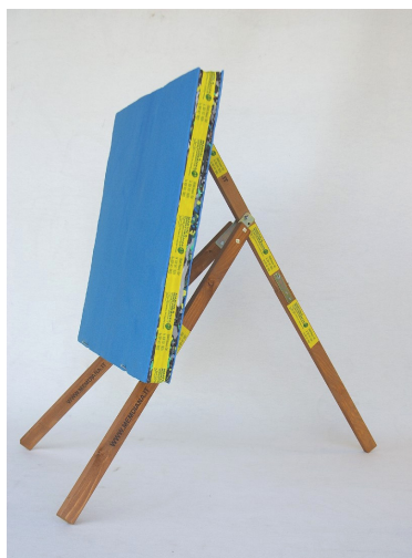
Art. A-550 cm 100x100x6/7 Su cavalletto A-308 pieghevole.