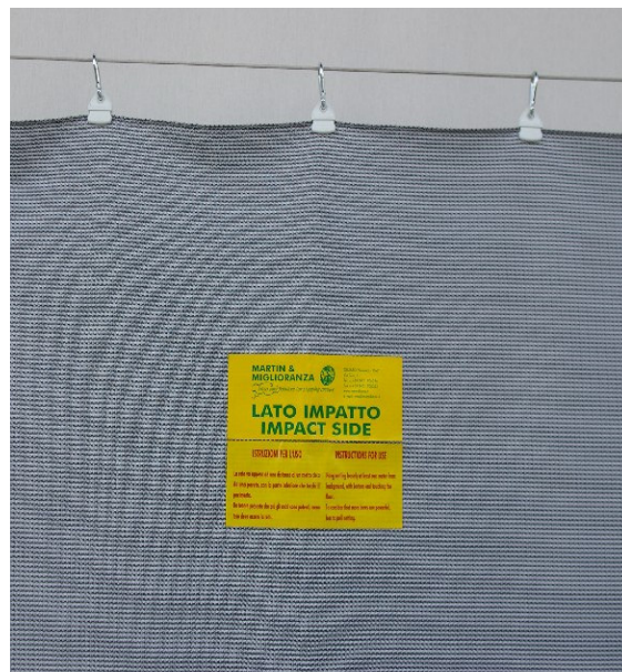
Rete salvafreccia con clips e moschettoni