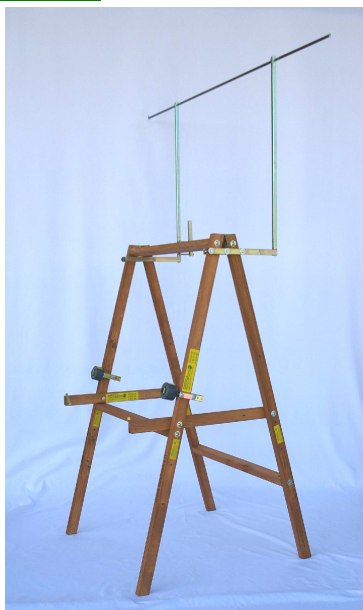
Porta rete A-410 su cavalletto A-402