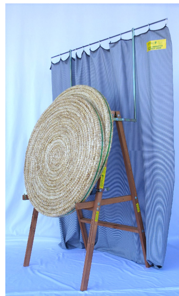
Porta rete A-410 con rete A-204 il tutto montato su cavalletto A-402